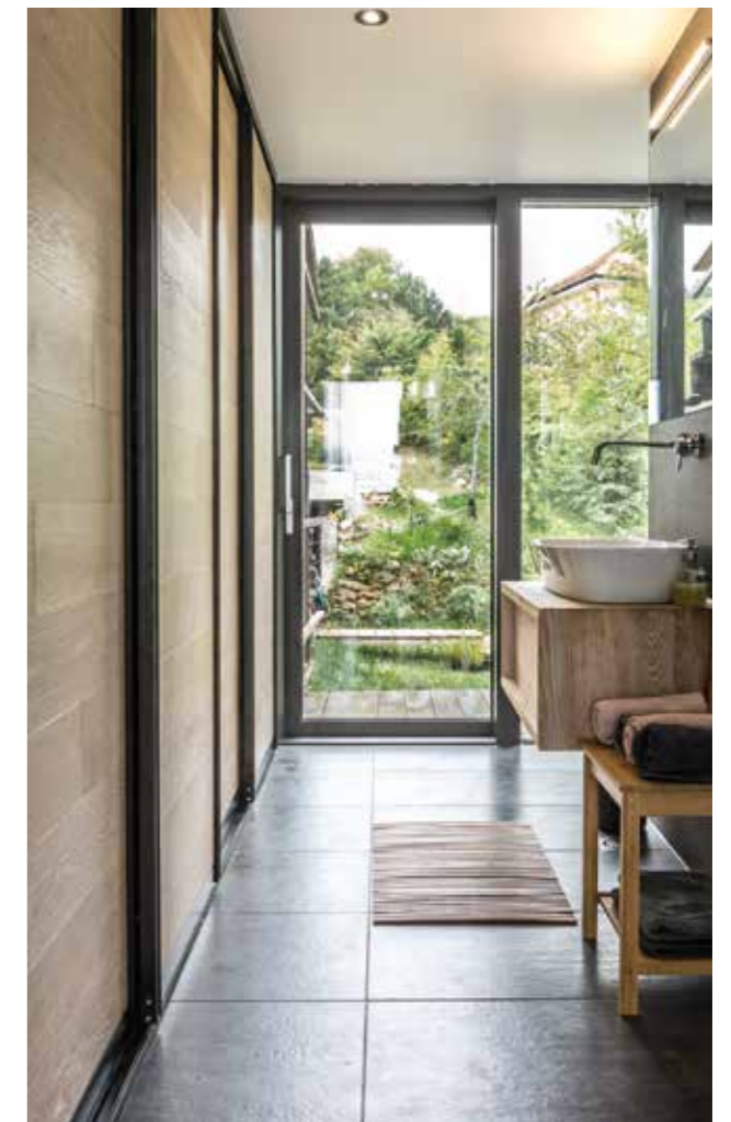
TREND KOLEKCIJA / BELIEVE BOJA