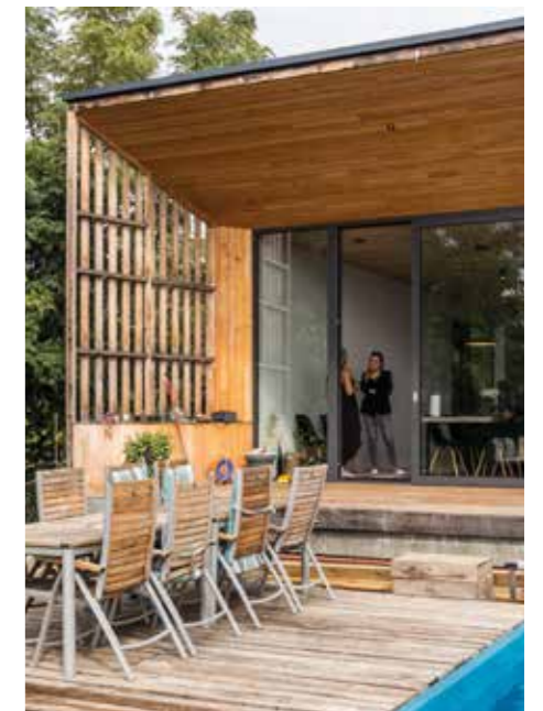
TREND KOLEKCIJA / BELIEVE BOJA

Suvremena, tehnološki napredna, a nježna prema prirodi.